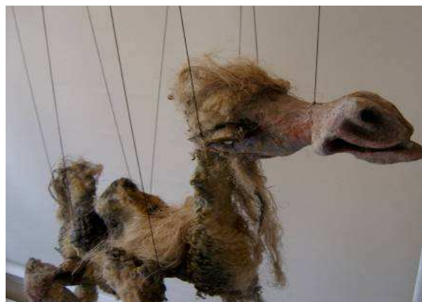
"Kamelen kom til sidst", Nørregaards Teater