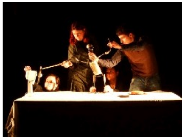
Crash test - studerende fra Polen og England forenes på Natscenen