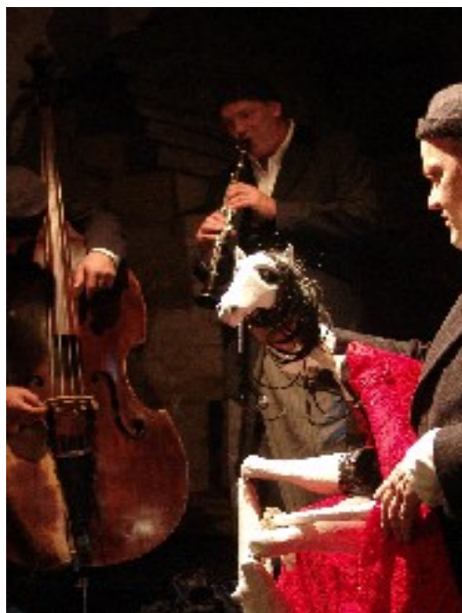
Figurtheater Tübingen: Salto.Lamento