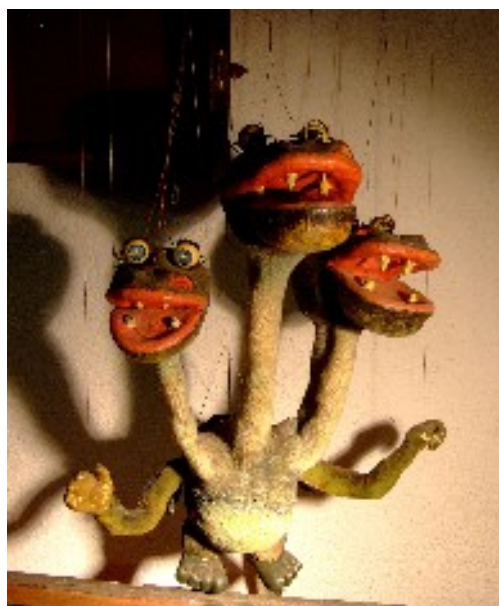
Dukke af Matthias F. W. Kantholz

Desuden vil "Strings" blive fremvist i middelaldercentrets biograf.